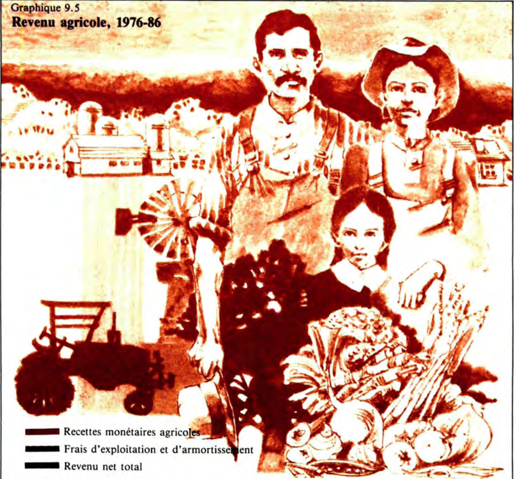
Graphique 9.5 Revenu agricole, 1976-86